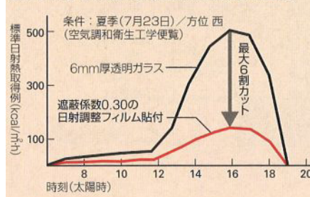
窓ガラスからの標準日射熱取得例(流入熱量)