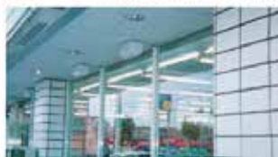
コンビニエンスストアの入り口や風除室の天井に

ウルトラベープPROは用途、目的に応じてあらゆる場所に設置可能。据え置き、壁面、天井など場所を選ばず、害虫をシャットアウト。コンパクトなので、お客さまの目につきにくく、店内外の美観も損わずに設置できます。