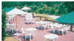
屋外レストランやイベント会場に据え置き