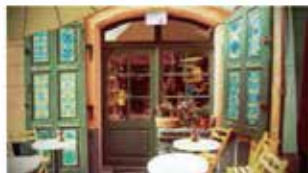
レストラン入り口に