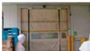
食品工場資材搬入口に