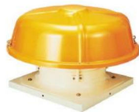
標準的・低騒音型、風圧シャッター型・防食型 自然換気型屋上換気扇