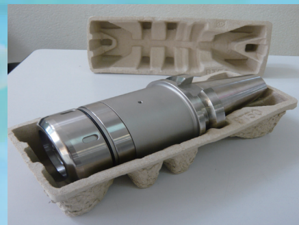
金属製品の保管防錆容器