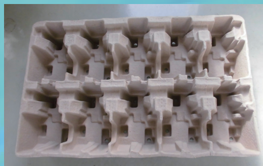
海外出荷用のトレイの脱プラ化